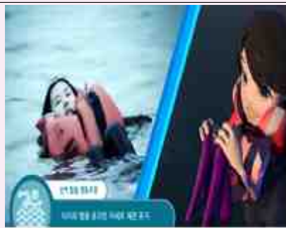
<그림2. 물속에서 체온유지>