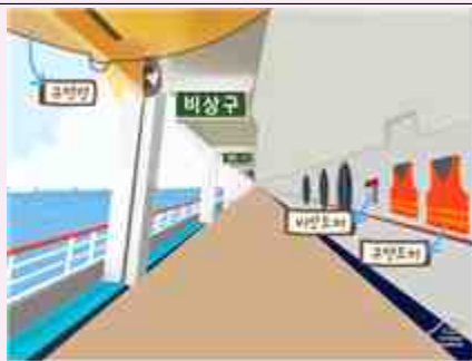
<그림1. 탈출로 및 구명조끼 확인>